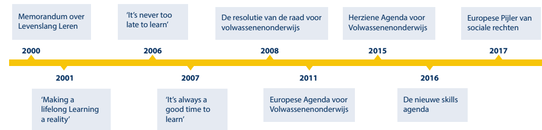
Figuur 2. Beleidshistorie van de Europese Commissie ter bevordering van de volwasseneneducatie

Leven Lang Leren werd het dominante beleidsdiscours in Europa. Met name vanaf het jaar 2000 speelde Leven Lang Leren een belangrijke rol bij het streven de Europese doelstelling te behalen om de meest competitieve en dynamische kenniseconomie te worden in de wereld. Deze uitdaging was in de jaren daarna het sturende beleidsprincipe als het ging om het volwassenenonderwijs. Een belangrijk ijkpunt voor het Europese onderwijsbeleid op het gebied van Leven Lang Leren is het 'Memorandum Levenslang Leren', gepubliceerd in 2000, waarin 6 actiepunten zijn opgenomen die tot op heden nog steeds doorwerken in Europese beleidsdocumenten (zie figuur 2). 8