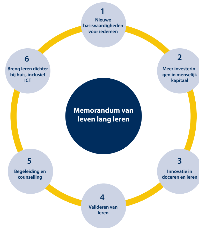
Figuur 3: 6 actiepunten van het Memorandum Levenslang Leren in 2000 9