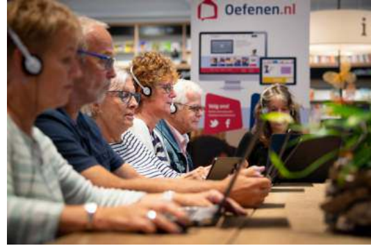
Lancering Groen doen in het Theelokaal van Stichting Schroeder in Den Haag