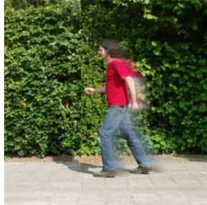
2 Hij loopt door doorlopen