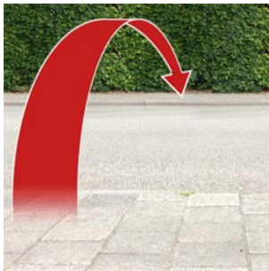
4 de overkant