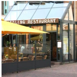
11 het restaurant