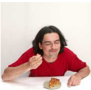
7 Hij vindt vinden