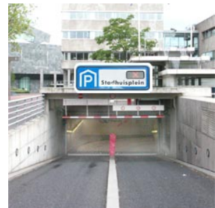
9 de parkeergarage