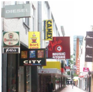
10 de reclame