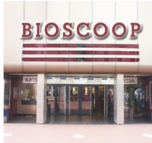
2 de bioscoop