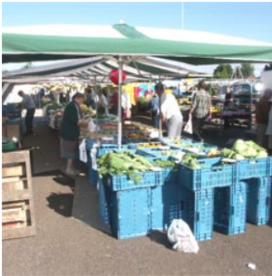
4 de kraam