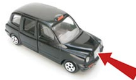
5 de voorkant