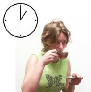
2 's middags