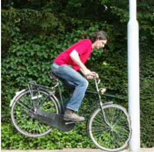
1 Hij botst botsen