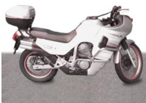
7 de motor