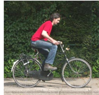
3 de fietser