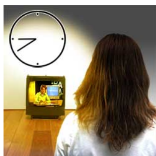
3 's avonds