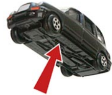
3 de onderkant