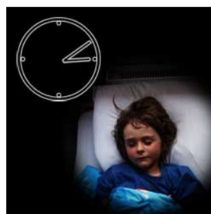
4 's nachts