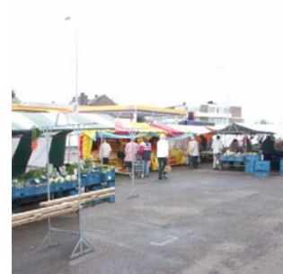
6 de markt