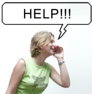
4 Zij schreeuwt schreeuwen