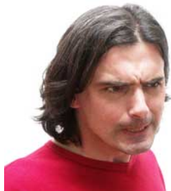
8 Hij is boos boos zijn

Zich vervelen Ik verveel me Jij verveelt je Hij verveelt zich Zij verveelt zich Wij vervelen ons Jullie vervelen je Zij vervelen zich