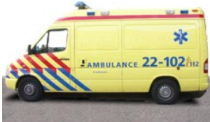
1 de ambulance