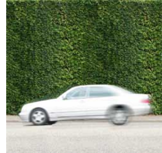
3 Hij remt remmen