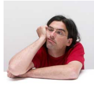
6 Hij verveelt zich zich vervelen