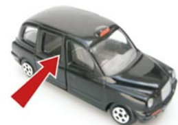
6 de zijkant