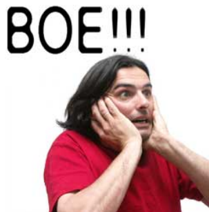
5 Hij schrikt schrikken