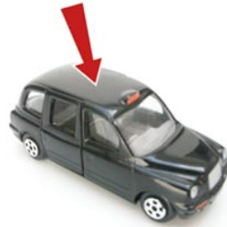
2 de bovenkant