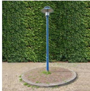
5 de lantaarnpaal