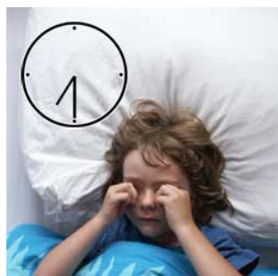
1 's morgens