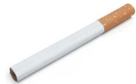
6 de sigaret