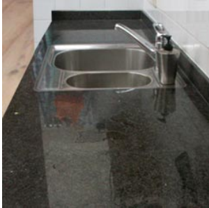
1 het aanrecht