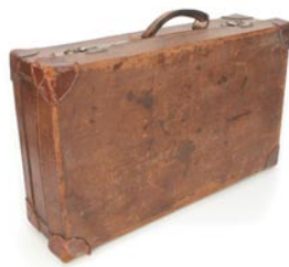
5 de koffer