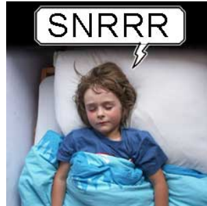
8 Hij snurkt snurken