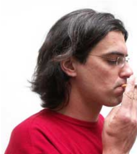
5 Hij rookt roken