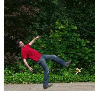
9 Hij glijdt uit uitglijden