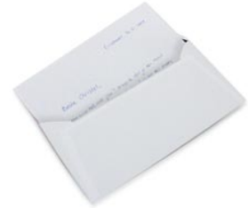
3 de brief