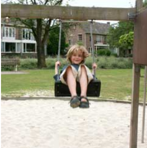
7 Hij schommelt schommelen