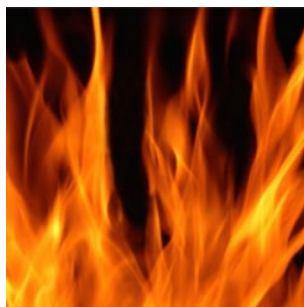
11 het vuur