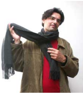
1 Hij doet om omdoen