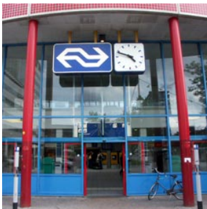
7 het station