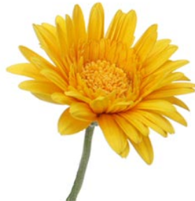
2 de bloem