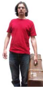
2 Hij draagt dragen