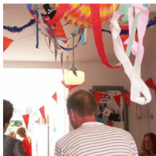
10 de verjaardag