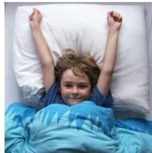
11 Hij wordt wakker wakker worden