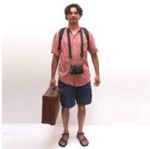
4 Hij gaat gaan