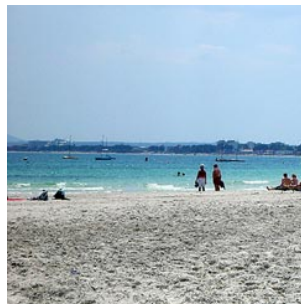
8 het strand