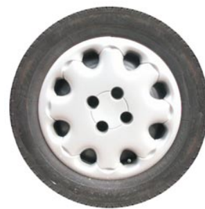
12 het wiel