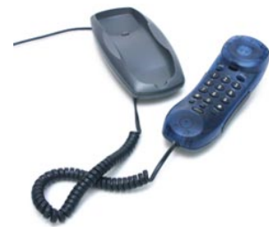
9 de telefoon