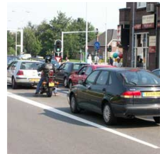
12 Het is druk druk zijn