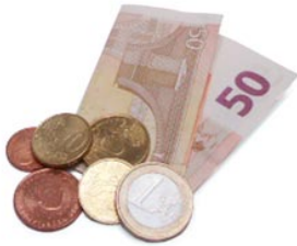
4 het geld