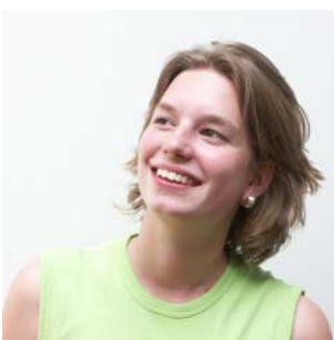
13 Zij is vrolijk vrolijk zijn