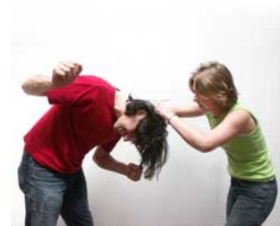
6 Zij maken ruzie ruziemaken